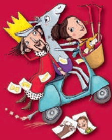
Illustration: Pe Grigo Grafik/Gestaltung: Tatjana Obermann Redaktion: Anneli Ganser Lektorat: Elke Vogel Herstellung: Brigitte Merkt